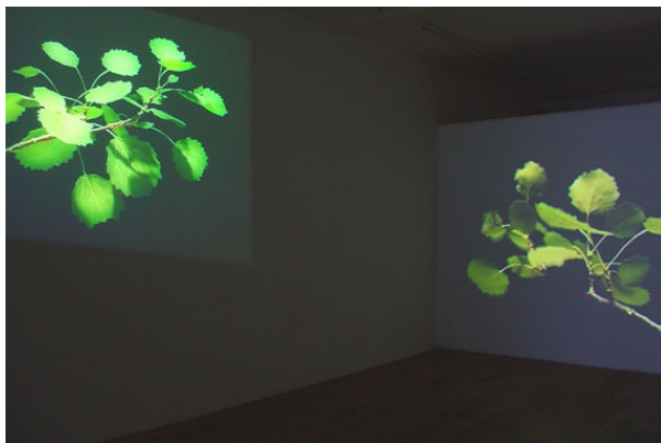
Video-installatie : "fluisterpopulier" M.Laaper

Alle werken hebben een relatie met de natuur en vormen daarmee een natuurlijke brug tussen de kunst in het Kasteel en de omliggende tuinen.