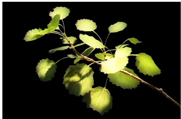
Detail: video-installatie: "Fluisterpopulier" M.Laaper